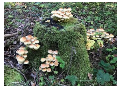
Dömostorpsutflykten bjöd inte på några rariteter, men en vacker stubbe med svaivelgul slöjskivling.